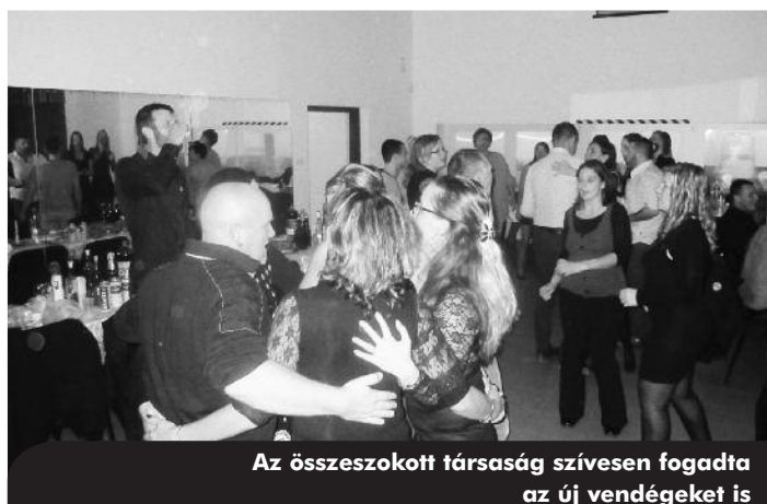
Az összeszokott társaság szívesen fogadta az új vendégeket is