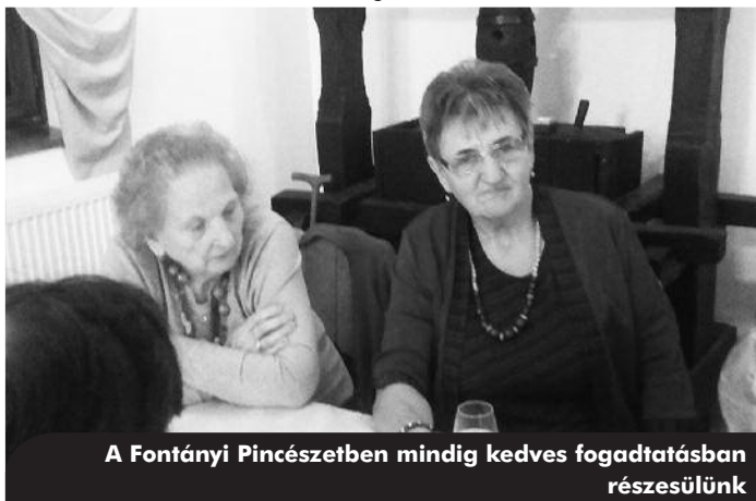
A Fontányi Pincészetben mindig kedves fogadtatásban részesülünk