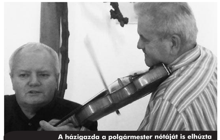
A házigazda a polgármester nótáját is elhúzta