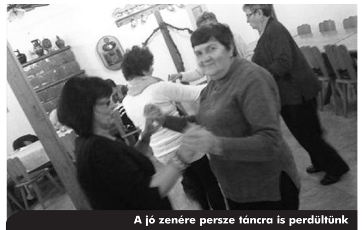
A jó zenére persze táncra is perdültünk