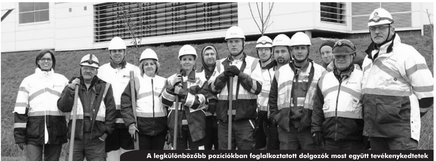
A legkülönbözőbb pozíciókban foglalkoztatott dolgozók most együtt tevékenykedtek