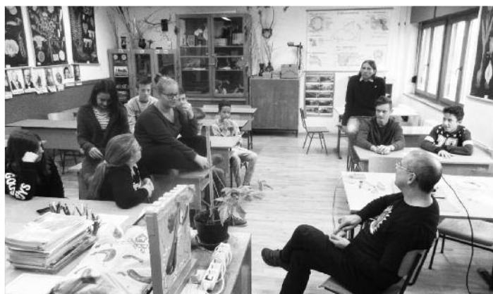
A gyerekek közvetlen formában teheték fel kérdéseiket