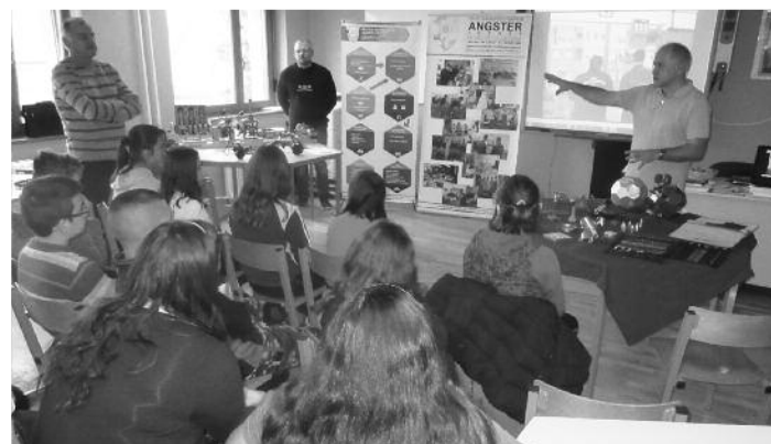
A középiskolák tanárai előadásokat és eszközöket is hoztak magukkal