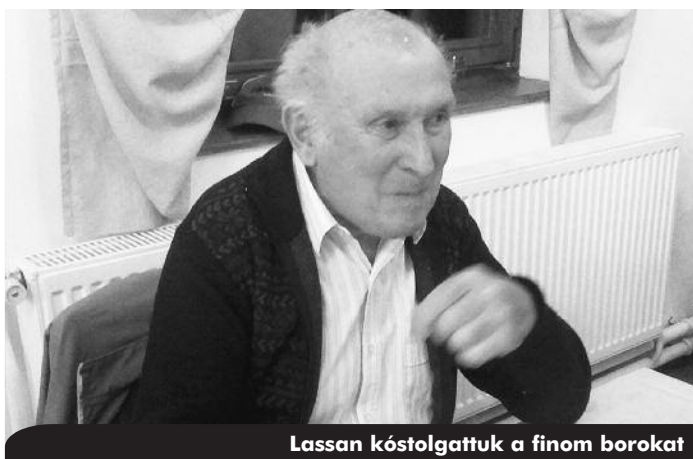
Lassan kóstolgtattuk a finom borokat

volt. A hangulat fokozására a házigazda elővette hegedűjét, játszott és énekelt, jó kedvével pedig magával ragadta az egész társaságot. A kedves, ismerős nóták, zeneszámok mindannyiunkat énekszóra és táncra is csábítottak. Mi nyugdíjasok egy rövid időre