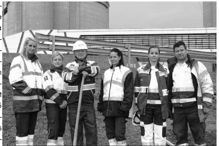
„A faültetési akció illeszkedik a LafargeHolcim úgynevezett „2030-as tervébe”