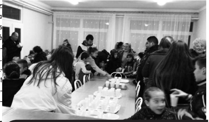
Mindenkinek jólesett a forró ital és a harapnivaló a közös séta után