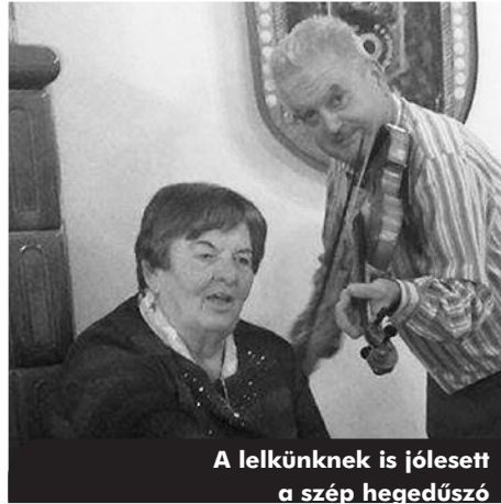
A lelkünknek is jólesett a szép hegedűszó