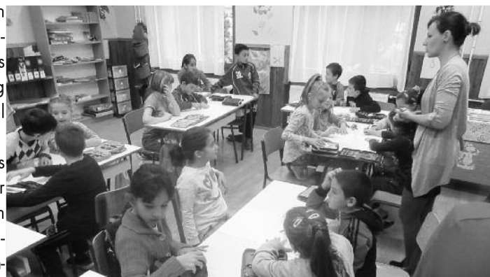
A kisebbek részére a tanítók készültek játékos önismereti gyakorlatokkal

Szakgimnáziumból érkezett előadó tájékoztartott minket, hogy náluk közgaz-