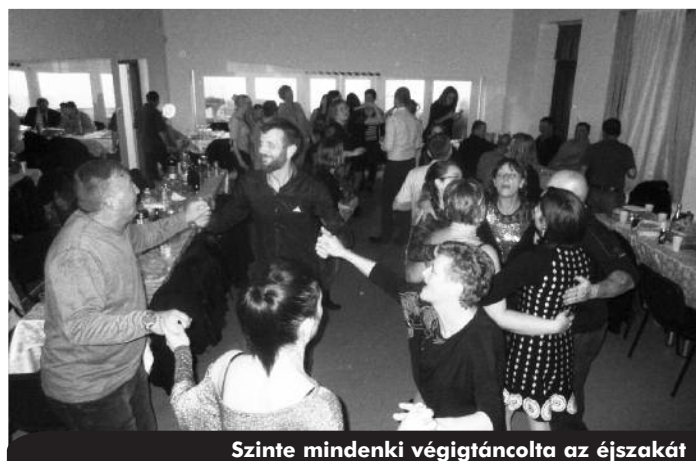
Szinte mindenki végigtáncolta az éjszakát