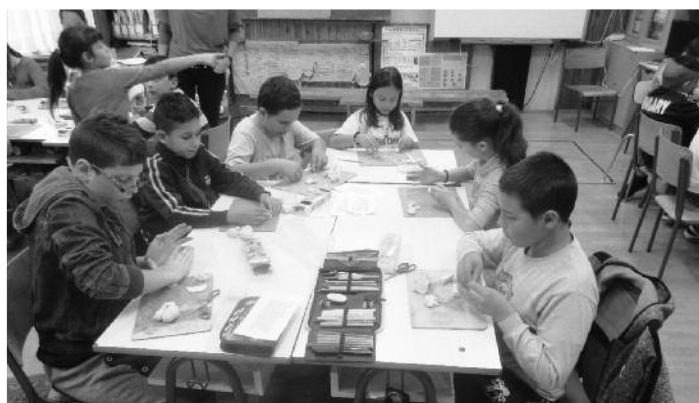
Az alsós gyerekek is kipróbálhatták magukat, milyen tevékenység az, ami leginkább kedvükre való