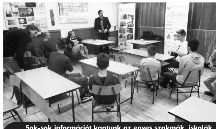
Sok-sok információt kaptunk az egyes szakmák, iskolák adta lehetőségekről