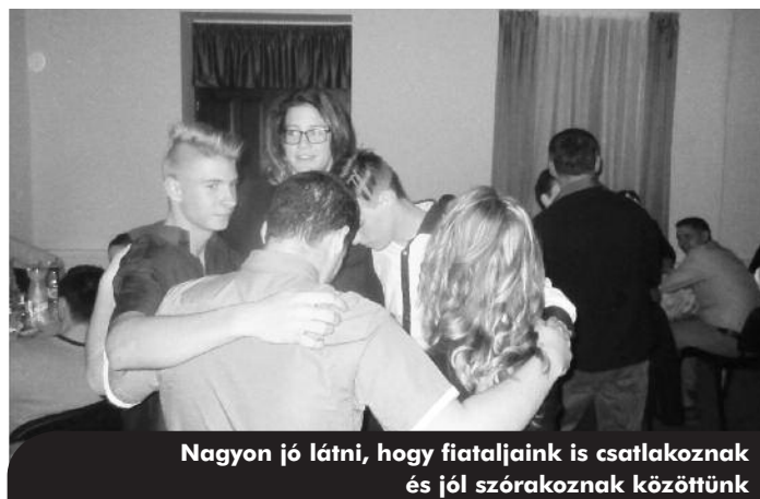
Nagyon jó látni, hogy fiataljaink is csatlakoznak és jól szórakoznak közöttünk