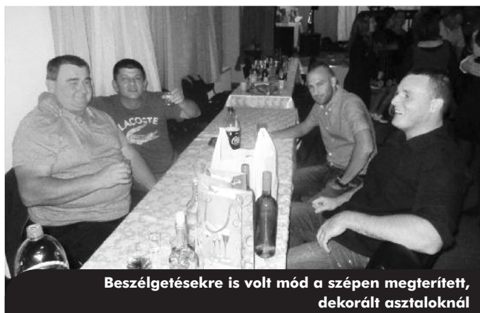
Beszélgetésekre is volt mód a szépen megterített, dekorált asztaloknál