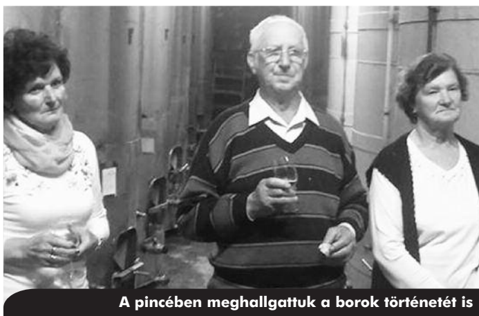
A pincében meghallgattuk a borok történetét is