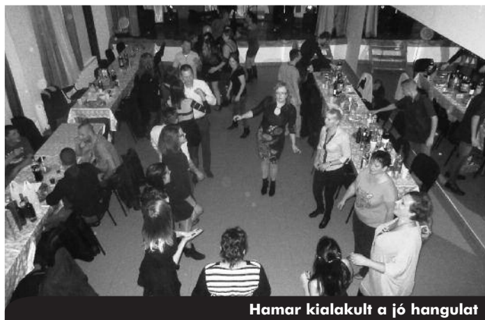
Hamar kialakult a jó hangulat