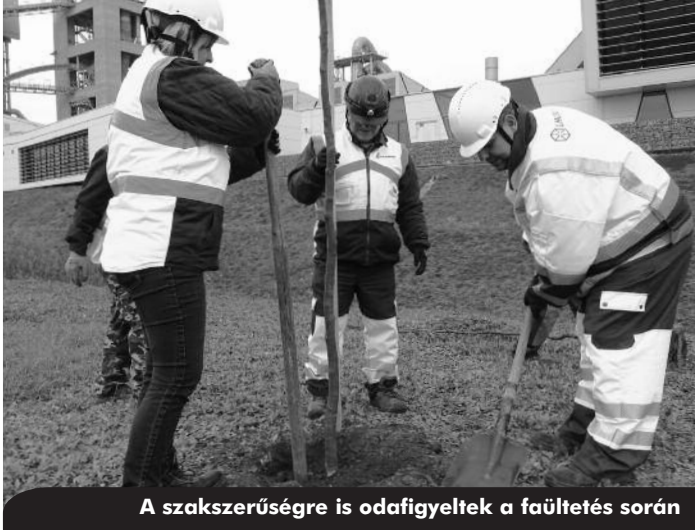
A szakszerűségre is odafigyeltek a faültetés során

Több száz fát ültetett november végén a Királyegyházi Cementgyár, amelyek több száz tonna szén-dioxidot kötnek meg élettartamuk alatt. A tízféle őshonos fafajta telepítésében a cég önkéntesei is közreműködtek.