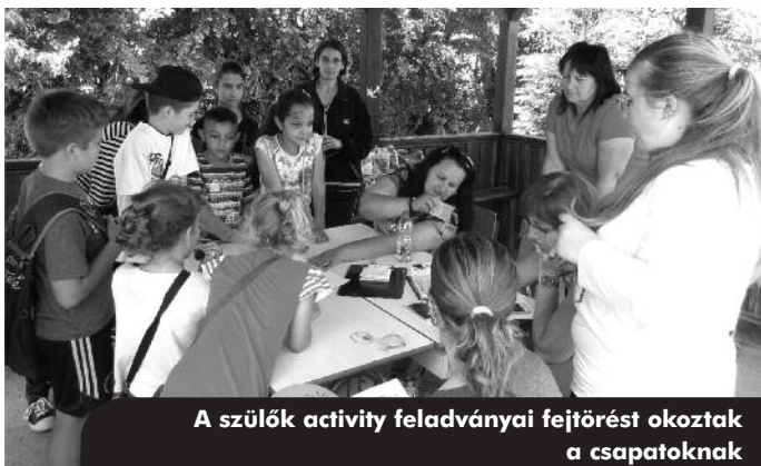
A szülők activity feladványai fejtevést okoztak a csapatoknak