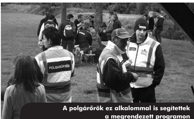
A polgárőrök ez alkalommal is segítettek a megrendezett programon