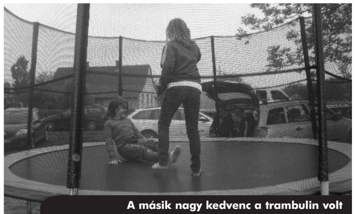
A másik nagy kedvenc a trambulín volt