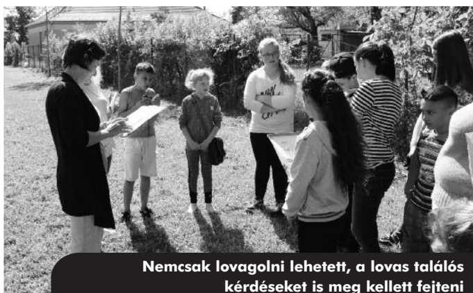
Nemcsak lovagolni lehetett, a lovas találós kérdéseket is meg kellett fejteni