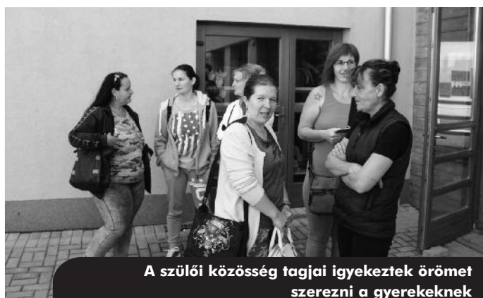
A szülői közösség tagjai igyekeztek örömet szerezni a gyerekeknek