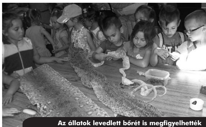
Az állatok levedlett bőrét is megfigyelhették