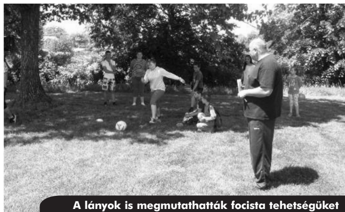
A lányok is megmutathatták focista tehetségüket