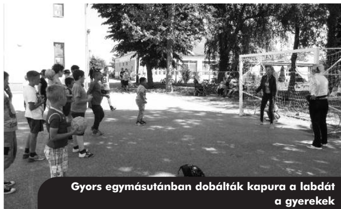
Gyors egymásutánban dobálták kapura a labdát a gyerekek