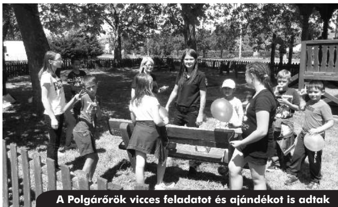
A Polgárőrök vicces feladatot és ajándékot is adtak