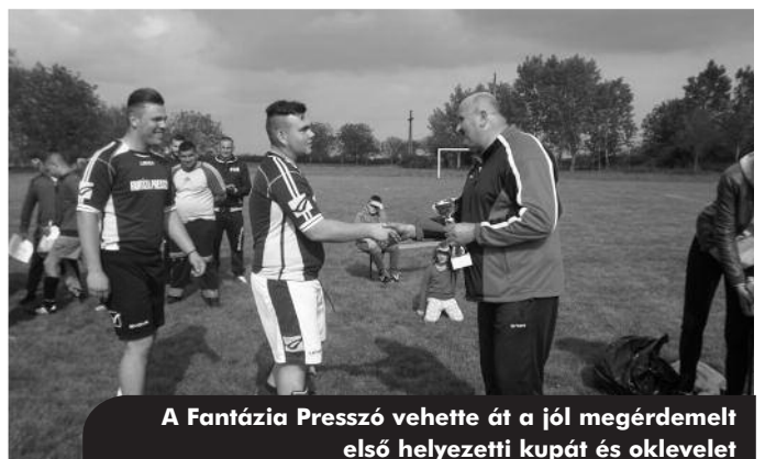
A Fantázia Presszó vehette át a jól megérdemelt első helyezetti kupát és oklevelet