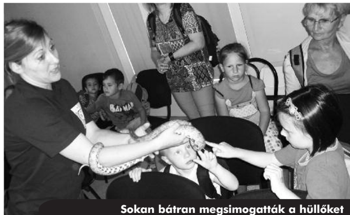
Sokan bátran megsimogatták a hüllőket