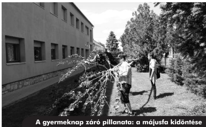
A gyermeknap záró pillanata: a májusfa kidöntése