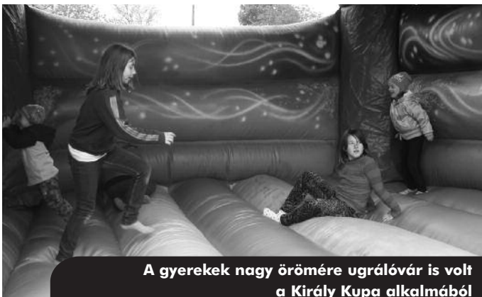
A gyerekek nagy örömeire ugrálóvár is volt a Király Kupa alkalmából