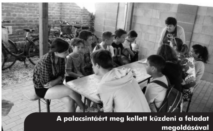
A palacsintáért meg kellett küzdeni a feladat megoldásával