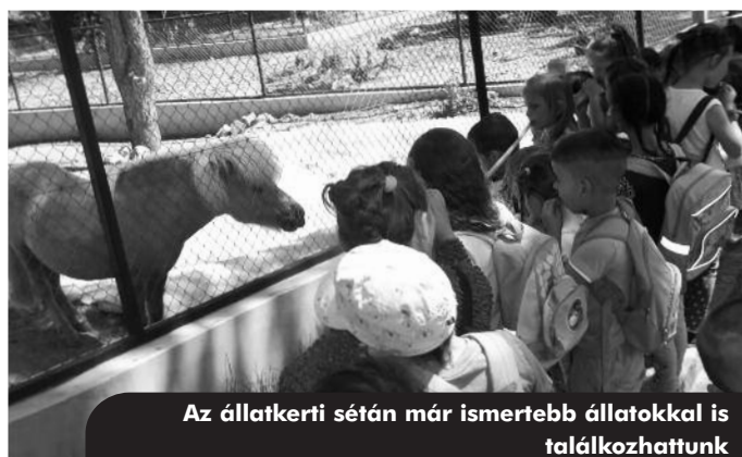
Az állatkerti sétán már ismertebb állatokkal is találkozhattunk