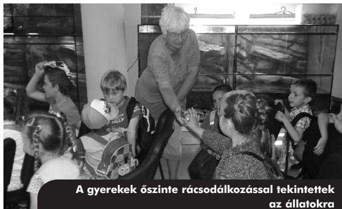
A gyerekek őszinte rácsodálkozással tekintettek az állatokra