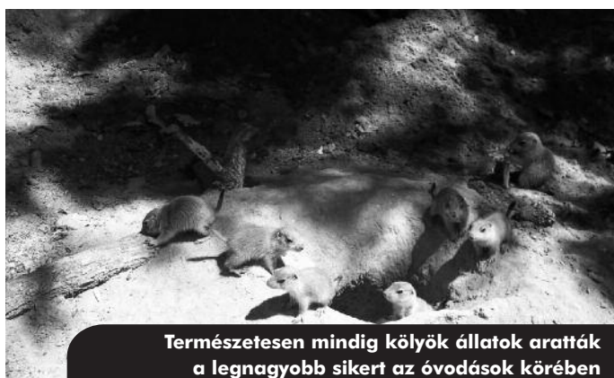
Természetesen mindig kölyök állatok aratták a legnagyobb sikert az óvodások körében