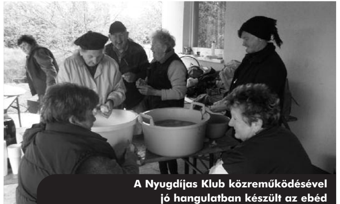
A Nyugdíjas Klub közreműködésével jó hangulatban készült az ebéd