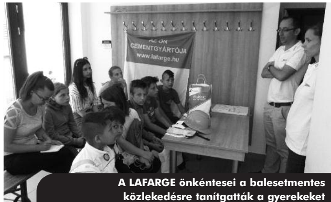
A LAFARGE önkéntesei a balesetmentes közlekedésre tanították a gyerekeket