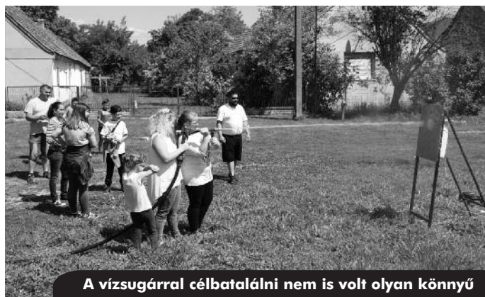
A vízszaggal célbatalálni nem is volt olyan könnyű