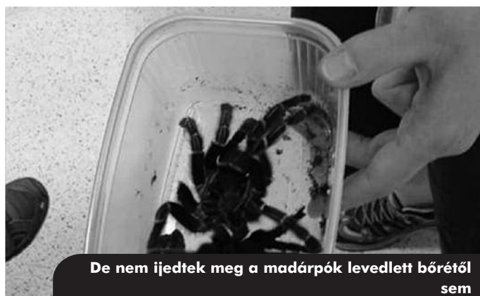
De nem ijedtek meg a madárpók levedlett bőrétől sem