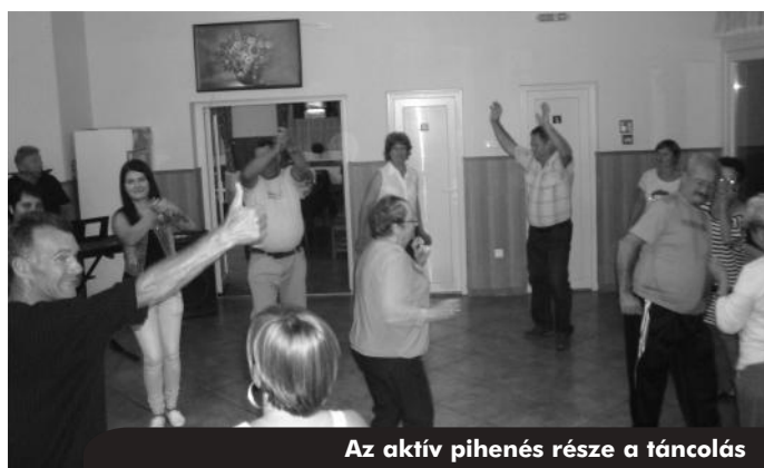
Az aktív pihenés része a táncolás