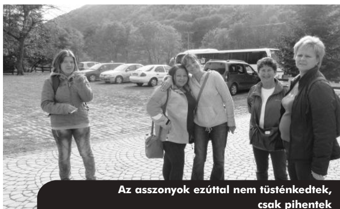
Az asszonyok ezúttal nem tüsténkedtek, csak pihentek