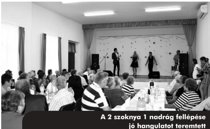
A 2 szoknya 1 nadrág fellépése jó hangulatot teremtett