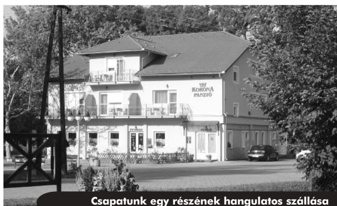
Csapatunk egy részének hangulatos szállása