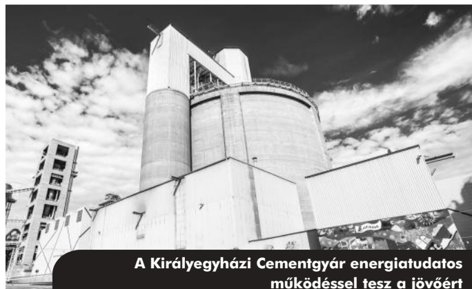
A Királyegyházi Cementgyár energiatudatos működéssel tesz a jövőért

A LAFARGE Cement Magyarország Kft. a korábbi ISO 9001 és 14001 KÖRNYEZET- ÉS minőségirányítási rendszerek után, következő lépésként az ISO 50001 energiairányítási szabvány bevezetését készíti elő.