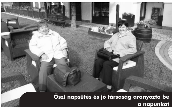
Őszi napsütés és jó társaság aranyozta be a napunkat