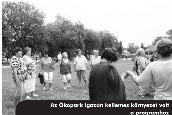
Az Ökopark igazán kellemes környezet volt a programhoz