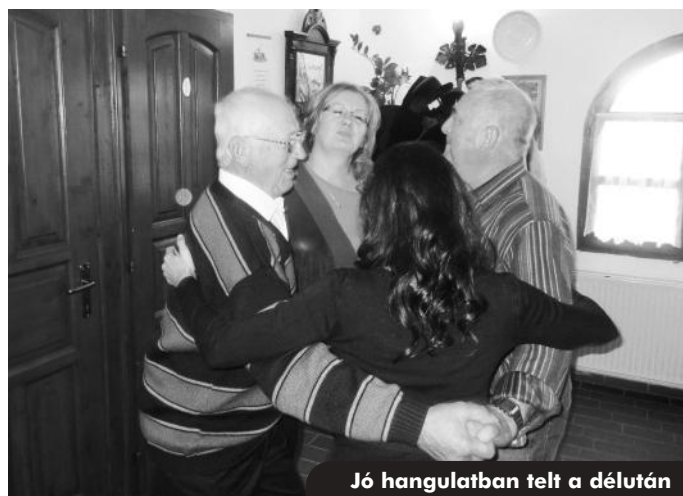
Jó hangulatban telt a délután