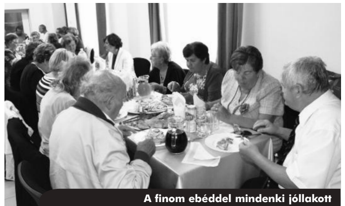
A finom ebéddel mindenki jóllakott