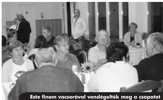
Este finom vacsorával vendégelték meg a csapatot