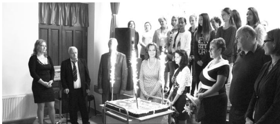
Az ünnepség végén együtt énekeltünk, majd felszeltük és megettük a születésnap tortát

Közalapítvány alapítása előtt már működő és azóta megszűnt KEFE-ről, a foci és kézilabdacsapatunkról is, akik sikeresen tevékenykednek a mai napig is és említésre került a szintén már megszűnt FESZES egyesület is.