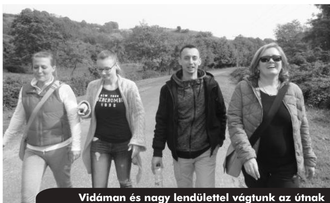
Vidáman és nagy lendülettel vágunk az útnak