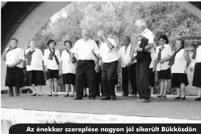
Az énekkar szereplése nagyon jól sikerült Bükkösdön