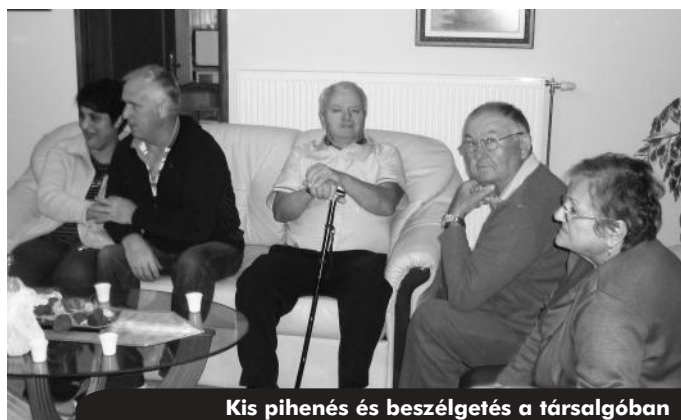
Kis pihenés és beszélgetés a társalgóban