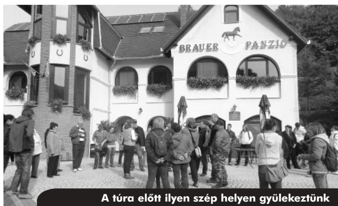
A túra előtt ilyen szép helyen gyülekeztünk