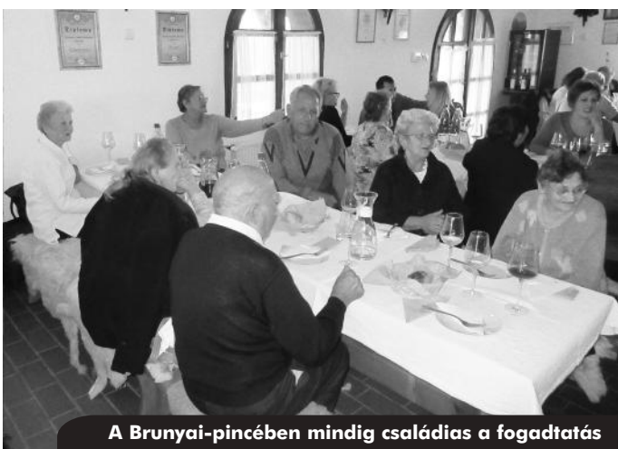
A Brunyai-pincében mindig családias a fogadtatás