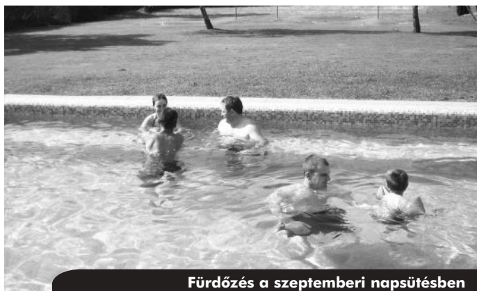
Fürdőzés a szeptemberi napsütésben