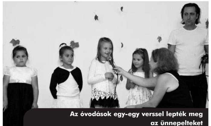
Az óvodások egy-egy verssel lepték meg az ünnepeket