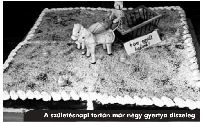
A születésnap tortán már négy gyertya díszleg