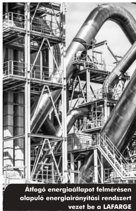
Átfogó energiaállapot felmérésen alapuló energiairányítási rendszert vezet be a LAFARGE

összhangban vannak a minőségirányítási és a környezetirányítási törekvésekkel, így e három rendszer megfelelő módon egymásra épül és támogatja egymást. Az energiairányítási rendszer alapelveit a cég honlapján is megtalálható energiapolitika foglalja össze. Az energiateljesítmény nyomon követése évek óta bevett gyakorlat a Királyegyházi Cementgyárban, az erre