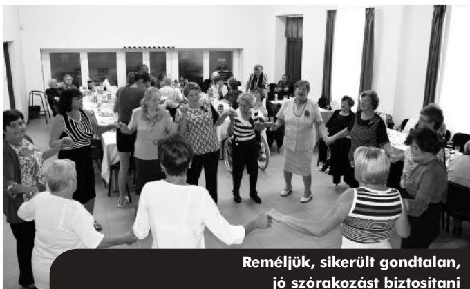
Reméljük, sikerült gondtalan, jó szórakozást biztosítani