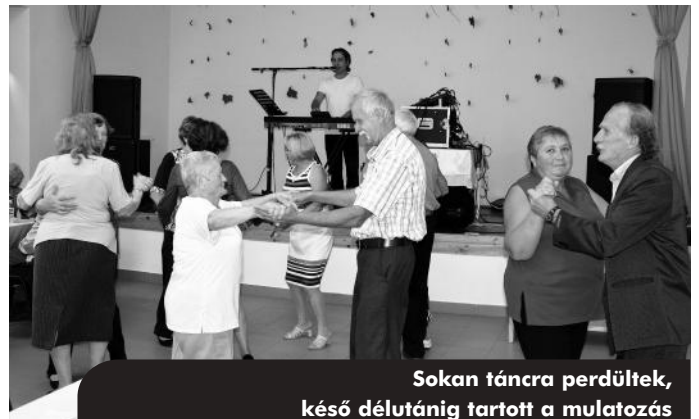
Sokan táncra perdültek, késő délutánig tartott a mulatozás