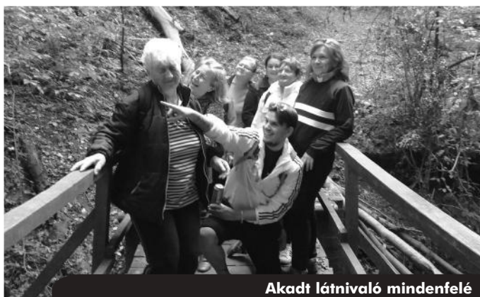
Akadtt látnivaló mindenfelé