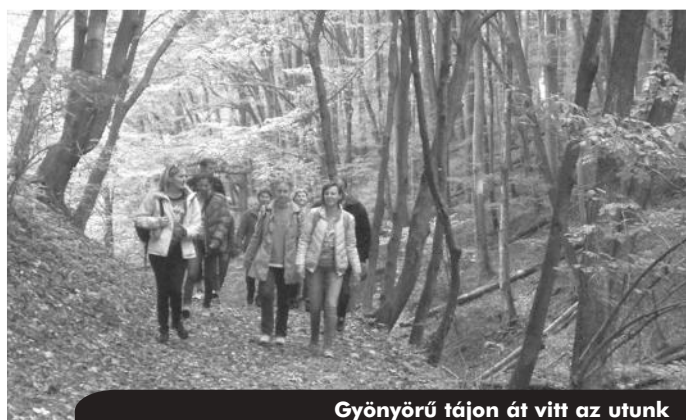
Gyönyörű tájon át vitt az utunk