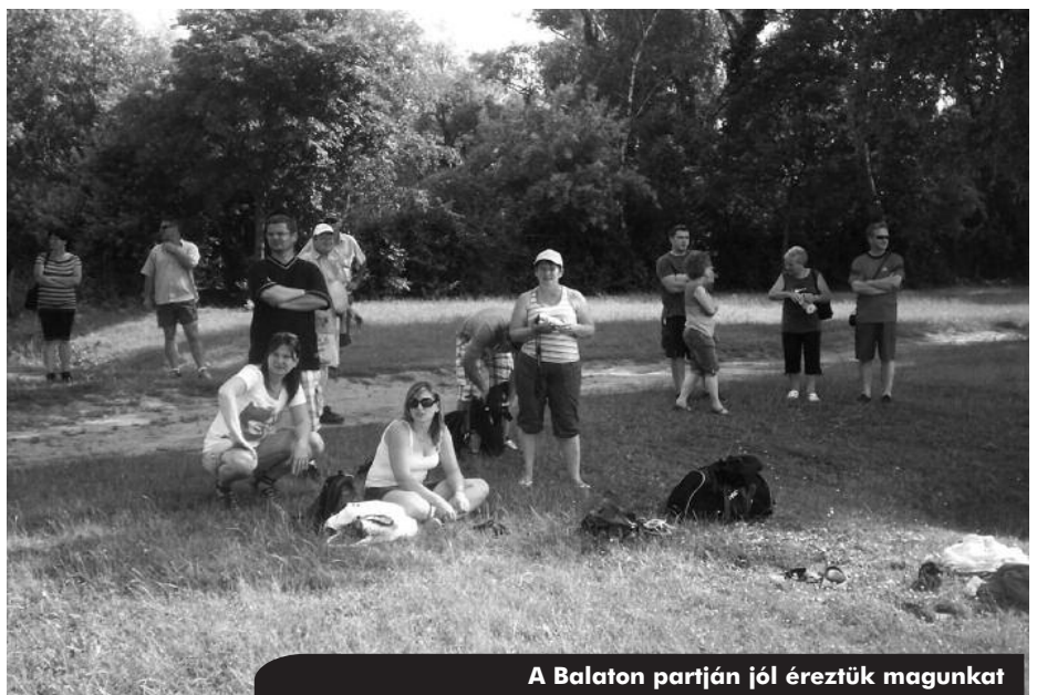
A Balaton partján jól éreztük magunkat