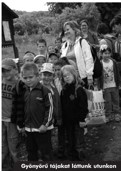
Gyönyörű tájakat láttunk utunkon

Sasrétre érve betértünk egy erdei iskolába, ahol jól ebédeltünk a hazaiból. Túravezetőnkkel kirándulni indultunk az erdőbe. Levélgyűjtő albumot kapott minden kisgyerek, amibe az erdőben található fákról gyűjthettünk egy-egy levelet. Megismertük a szilfát, a juharfát, tölgyet, szomorúfűzfát, megnéztük és megkóstoltuk az Almás-forrás vizét. A nap végére jól elfáradtunk, és élményekkel teli indulhattunk haza.