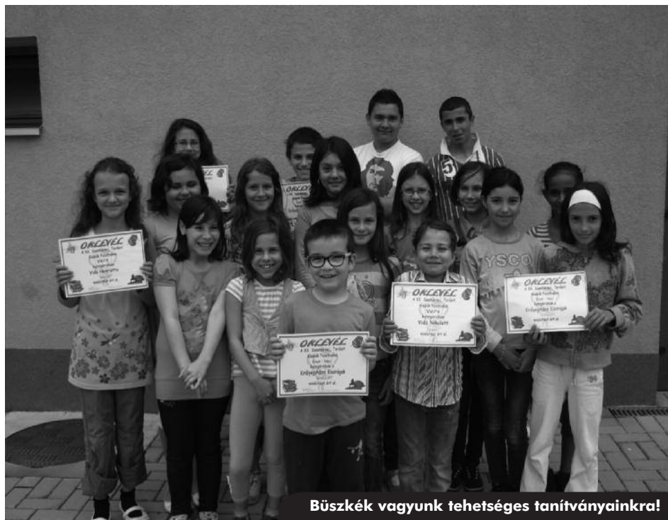
Büszkék vagyunk tehetséges tanítványainkra!

Idén 20. alkalommal rendezték meg Szentlőrincen a Kistérségi Kisdiák Fesztivált április 24-25-én.