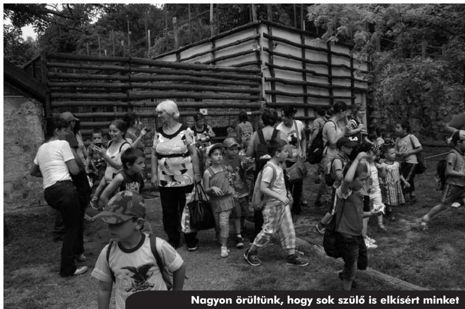
Nagyon örültünk, hogy sok szülő is elkísért minket

Boldog izgalommal várták a nagy napot az óvodások, hogy a Sasrétre kiránduljunk. Almamelléig vitt minket a busz, ahol sok érdekes látnivaló várt ránk. Először a Vasúti Múzeumot néztük meg, kipróbálhattuk a régi idők lovas vasúti kocsiját. Ezután az igazi kisvasúton utaztunk fél órán át Sasrétig, megcsodálhattuk a táj szépségét, végre nézhettünk dombot, erdőt. Láttunk sok halastavat, halra várakozó kitartó horgászokat, őzikéket, madarakat. Bár az időjárás nem kedvezett utunk során, de ez cseppet sem szegte kedvünket.