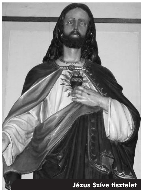
Jézus Szíve tisztelet

Június 7-én, pénteken ünnepeltük Jézus Szentséges Szívét, mely plébániánk fogadalmi ünnepe. Ennek kapcsán szeretném röviden összefoglalni, hogy mit is jelent a Jézus Szíve tisztelet.