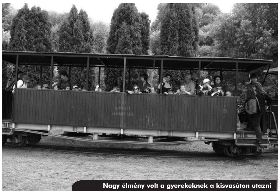
Nagy élmény volt a gyerekeknek a kisvasúton utazni