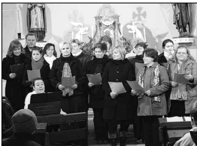
Az iskola nevelőtestületének énekkarát ezúttal az óvónők is erősítették