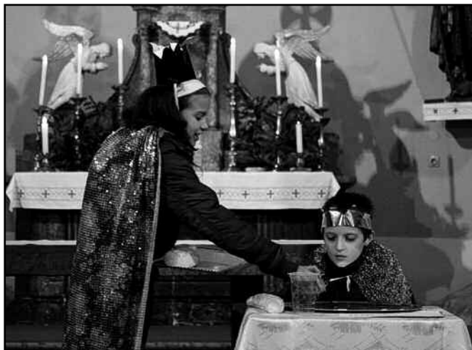
A negyedik osztályosok a szeretet erejéről szóló mesét játszottak el