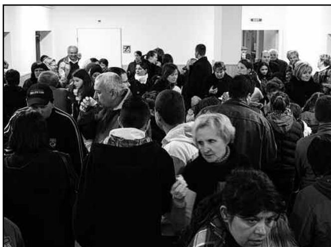
A nyugdíjasok által készített sütemények, a forralt bor és a forró tea elfogyasztásával zártuk az estét