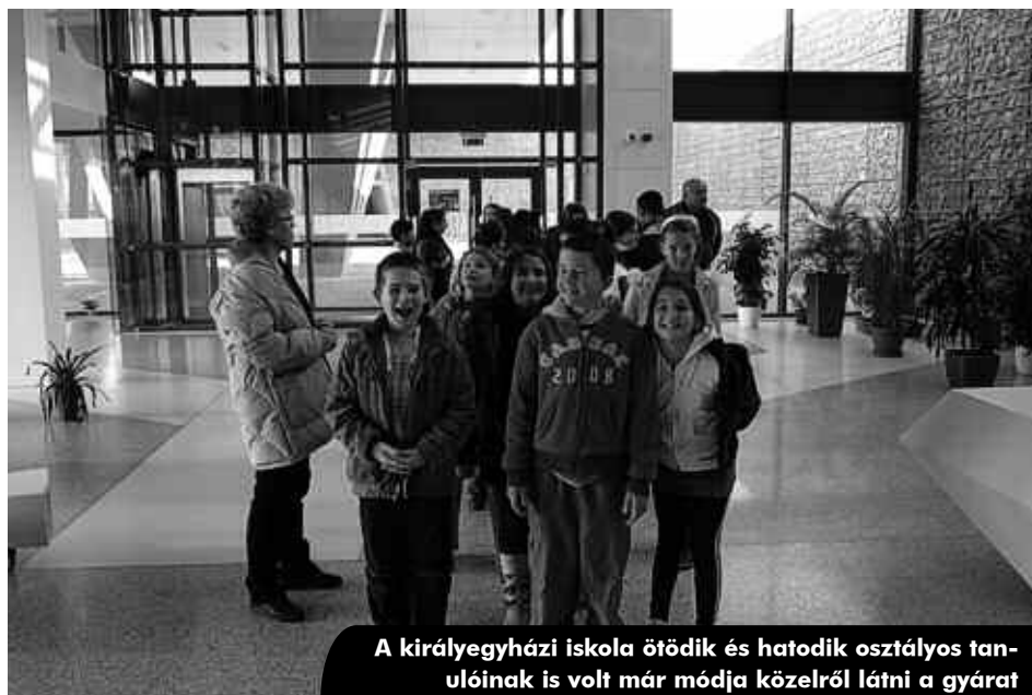
A királyegyházi iskola ötödik és hatodik osztályos tanulóinak is volt már módja közelről látni a gyárat

A 2011 júliusa óta próbaüzemben működő és szeptember 15-én felavatott királyegyházi cementgyár iránt egyre nagyobb az érdeklődés. Többeket vonz a hatalmas építmény látványa, de vannak, akiket maga a gyártás folyamata érdekel. Az igényeknek megfelelően a gyár munkatársai folyamatosan szervezik a gyárlátogatásokat, bemutatókat, előadásokat. Már hírt adtunk róla, hogy a királyegyházi iskola hetedik és nyolcadik osztályos tanulói a pályaválasztás céljából látogattak ide, de jártak már itt pécsi középiskolások és egyetemisták is. Királyegyháza Önkormányzatának Képviselő-testülete, a Társadalmi Tanács tagjai, valamint az orvosi rendelő és az