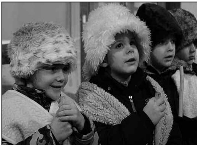
Az óvodások a betlehemes játékkal a hagyományokat elevenítették fel