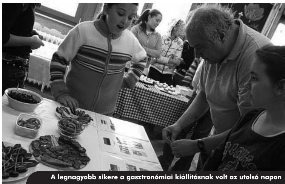
A legnagyobb sikere a gasztronómiai kiállításnak volt az utolsó napon

kulturális örökségével (az irodalom, a képző- és alkalmazott művészet, a vallástörténet, a zene, a tudomány- és technikatörténet sajátosságaival), ter-