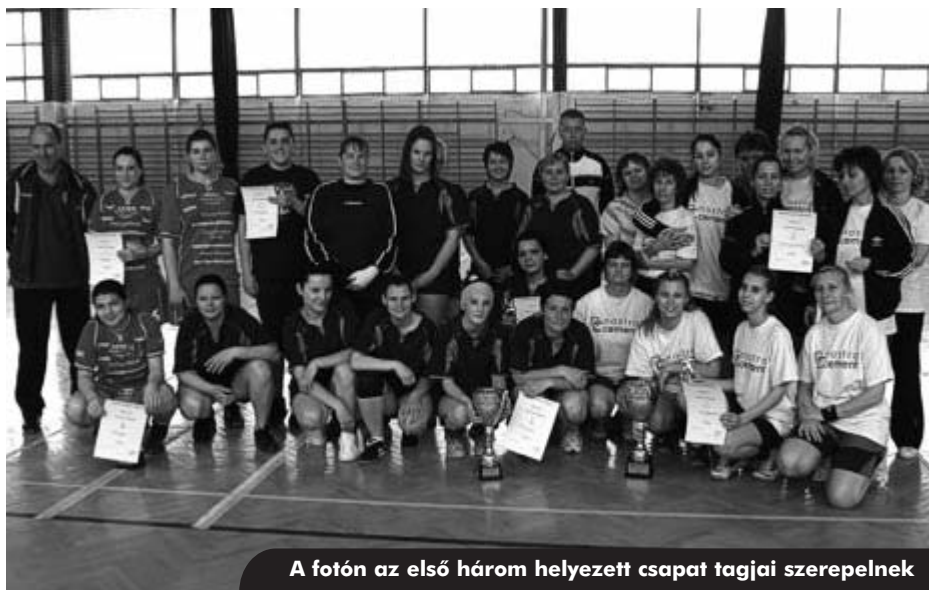
A fotón az első három helyezett csapat tagjai szerepelnek

Női amatőr kézilabdacsapatunk április 17-én délután rendezte meg a Nostra Kupát a szentlőrinci sportszarmokban. Kézilabdás lányaink hetente edzenek a Közalapítvány által bérelt teremben, és rendszeresen vesznek részt amatőr csapatoknak szervezett tornákon,