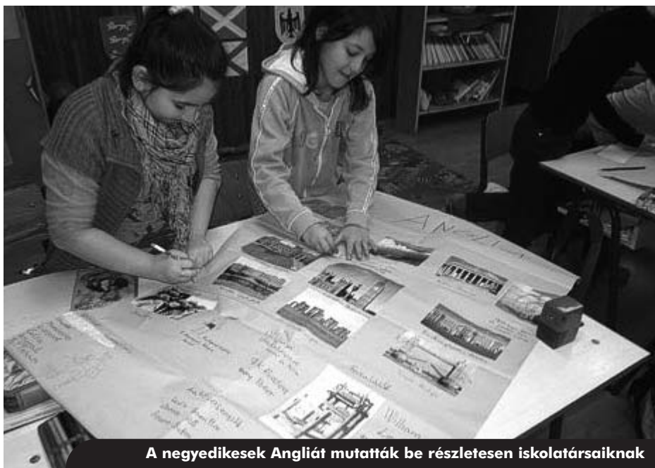
A negyedikesek Angliát mutatták be részletesen iskolatársaiknak

2011. február 22-25. között került megrendezésre a SZONEK Királyegyházai Általános Iskolában „A multikulturális Európa. Az Európai Unió” című témahét. A tanulók a tananyagot és az Európai Unió témakörét négy tanítási napon keresztül rugalmas időkeretek között, változatos és sokszínű módszerek segítségével dolgozták fel. A tanulási folyamat így a hagyományostól eltérően sokkal inkább a tanulói aktivitásra és kreativitásra épült, fejlesztette az önállóságot, de az együttműködés készségét, valamint a rendszerben gondolkodás, a rendszerszemlélet fejlődését is. A témahét programjaiban az intézmény valamennyi tanulója, az intézményben tanító összes pedagógus, valamint az intézmény technikai személyzete egyaránt aktívan részt vett. Projekt módszerrel került feldolgozásra az Európához tartozás, az európai azonosságtudat és az Európai Unió témaköre. A tanulók megismerkedtek Európa sokszínű, ám mégis egységes